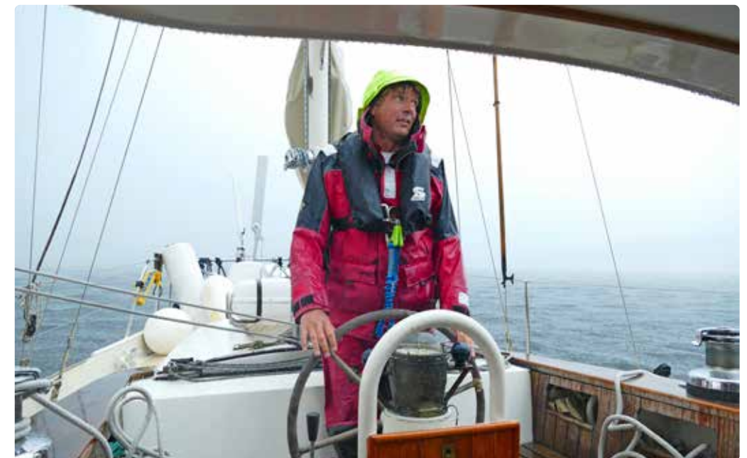
Het wordt al herfstweer in Noorwegen.

Ampere , 's werelds eerste volledig elektrische autoveer. De machtige veerboot is in de plaats gekomen van een fossiel exemplaar dat per jaar één miljoen liter diesel verstookte. Nog voordat de klep omhooggaat en wij erop kunnen rijden, hangt Ampere al aan een grote stekker. Aan beide kanten van de fjord kan het veer tien minuten bijladen. In alle rust varen we naar de overkant. Het uitzicht over de fjord is grandioos, de frisse, schone lucht een verademing. In Noorwegen lijkt de elektrische revolutie niet meer te stoppen. De energievoorziening is al bijna volledig hernieuwbaar, dankzij investeringen in waterkracht. De Noren maken slim gebruik van de natuurlijke omstandigheden, stimuleren innovatie en versoepelen de overgang naar volledig fossielvrij transport. Hebben we hier zojuist de toekomst van veel andere landen gezien?