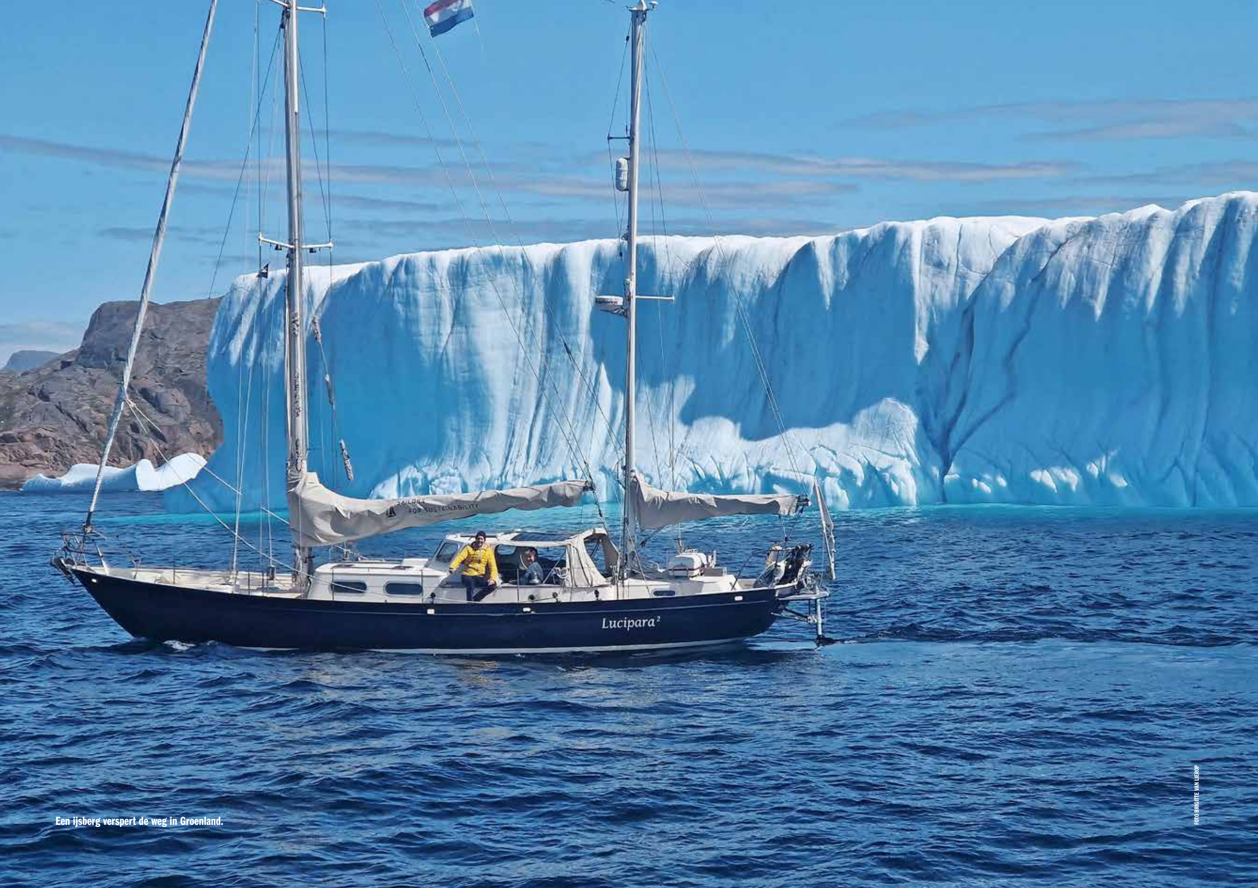
Een ijsberg verspert de weg in Groenland.