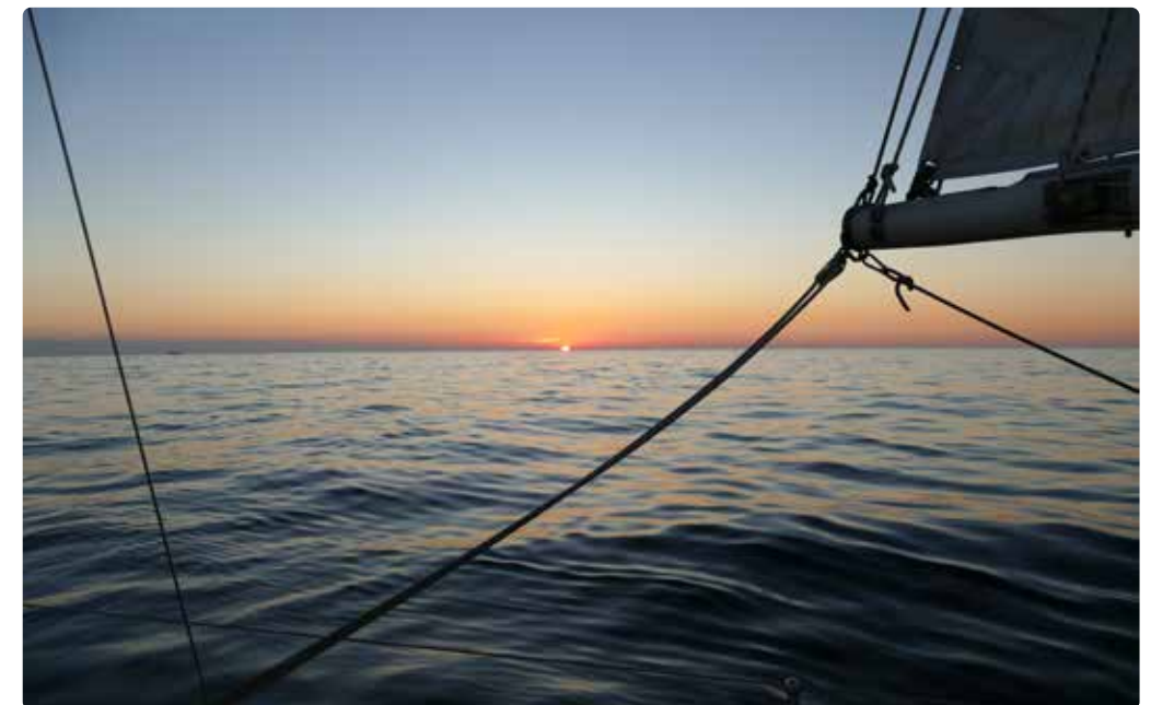
Tijdens onze eerste nacht op zee is het bijna windstil.

We gunnen onszelf maar een paar uur slaap. Nadat we door de sluis zijn, varen we in alle rust door het Noord-Oostzeekanaal naar Kiel. Daar leggen we 's avonds aan om de volgende dag onze eerste 'duurzame oplossing' te bezoeken.